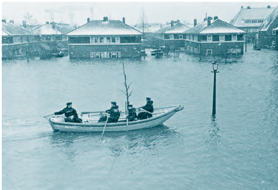
Afb. 1 De ramp in Tuindorp Oostzaan, 14 januari 1960.

enige en recent verschenen boek over de ramp, door historicus Jan de Roos, draagt dan ook de toepasselijke naam De vergeten watersnood . Toch was de gebeurtenis in 1960 ook nationaal zeer groot nieuws. Zowel in de ‘noodfase’ als in de daaropvolgende ‘herstel-’ of ‘schadecompensatiefase’, waarin vooral de campagne van het Nationaal Rampenfond centraal stond, haalde de ramp de voorpagina’s van veel lokale en nationale kranten. 4