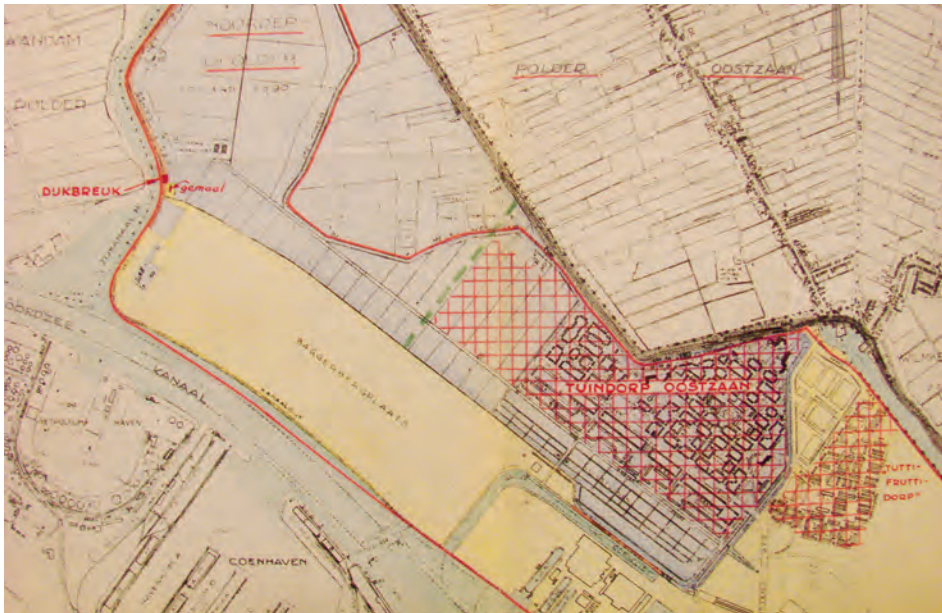
Afb. 2 Kaart uit het boek van Jan de Roos, De Vergeten Watersnood: Tuindorp Oostzaan overstroomd , januari 1960.