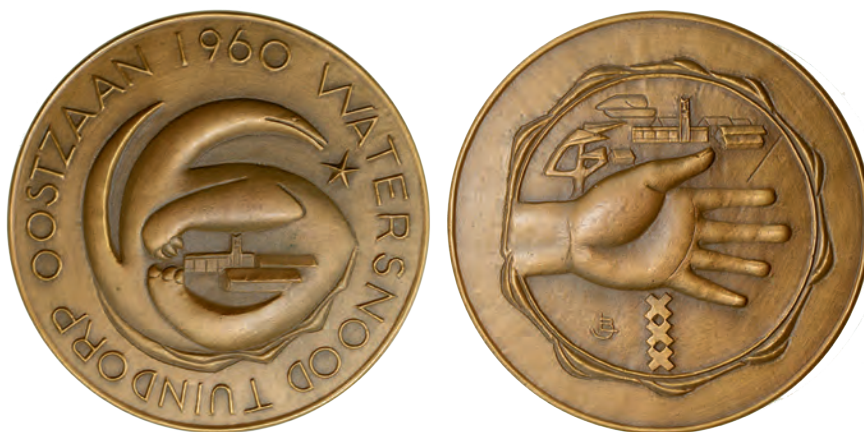
Afb. 7 Om geld in te zamelen werd na de ramp onder meer een bronzen penning in omloop gebracht, ontworpen door Leo Braat. De penning, met rand-schrift ‘Tuindorp Oostzaan 1960’, toont Tuindorp in de klauwen van het watermonster. Op de keerzijde staat ‘De helpende hand van het Nederlandse volk’.