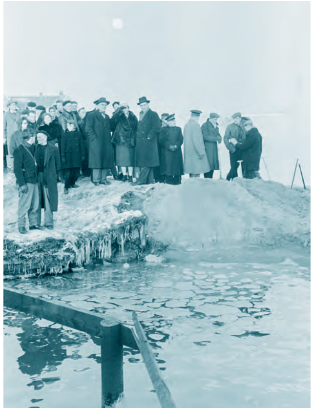
Afb. 6 15 januari 1960: Koningin Juliana en burgemeester Van Hall bezoeken het rampgebied.

Het is voornamelijk deze laatste kritiek van Den Uyl die ook terugkeert in latere literatuur rond het thema van schadevergoedingen in het geval van rampen en calamiteiten. Ten eerste klinkt de specifieke kritiek op de afwachtende en berekenende houding die de nationale overheid in dit geval aannam door in de conclusies die De