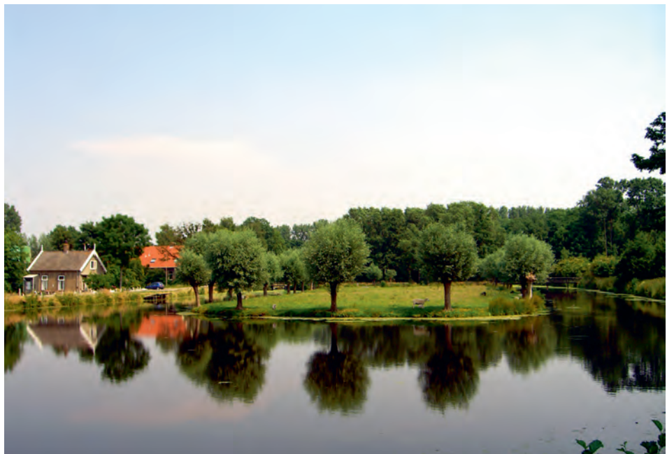
Afb. 4 De Loet nu: tot recreatiegebied getransformeerd boezemland.

In 1710, zo'n vijftig jaar later, liep het water van de Lekkerkerkse Maalboezem opnieuw over de kades. 34 Dit leidde niet tot juridische acties, zodat we mogen aannemen dat er werd er geschikt dan wel geslikt. Maar in 1752 riepen de Ouderkerkse waarslieden een 'buurstemme' bijeen om juridische vervolgstappen te kunnen zetten in verband met de inmiddels opnieuw ontstane overlast: 35 'considerabele schade en ongemakken [...] welke ... zekerlijk de totale ruïne van de voornoemde landen zal veroorsaken [...]'. 35