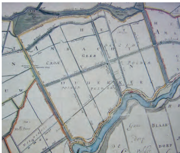
Afb.1 De polder Cromme, Geer en Zijde circa 1790 (het zuidoosten is boven).

terwegen buiten de polders. Bij het uitmaalvermogen speelden de regimes van de rivieren, en met name de hoogtes van de rivierbedding en de waterstanden in de rivier, een rol. Water kon binnenkomen uit de grote doorgaande rivieren (Lek en Hollandse IJssel), vanuit andere polders (via kwel, of langs- of doorstromende boezems) of vanuit de lucht. De Lek kende vanaf 1530 (doorbraak Waal bij Nijmegen) tot 1707 (aanleg Pannerdens Kanaal) een lage waterstand doordat de Waal veel water aantrok. Na 1707 steeg het peil in de Lek weer. De Hollandse IJssel was sinds 1285 door een dam gescheiden van de Lek, wat de waterstand op de IJssel verlaagde. Oplopende waterstanden en de opslibbing maakten de lozing op de rivier allengs moeilijker. 5 In de achttiende eeuw kan ook Lekwater de afvoer via de IJssel hebben gehinderd doordat het stroomafwaarts in de Maas het waterpeil verhoogde.