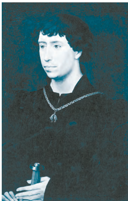
Afb. 2. Karel van Charolais. Olieverf op eiken, Rogier van der Weyden (werkplaats en omgeving), circa 1460. Gemäldegalerie, Staatliche Museen, Berlijn.