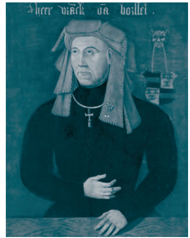
Afb. 4. Frank van Borselen. Olieverf op eiken, kopie uit circa 1480 naar verloren gegaan origineel. Rijksmuseum Amsterdam objectnr. SK-A-499, bruikleen aan Zeeuws Museum.