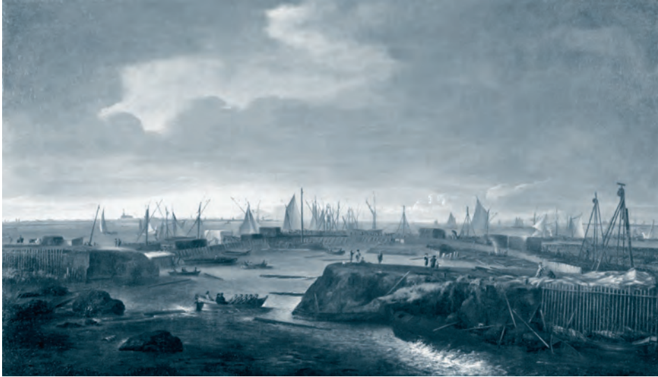
Sluiting van de doorbraak in de Westfriese Omringdijk bij Scharwoude. Olieverf op doek door Matthias Withoos, 1676. Westfries Museum, Hoorn.