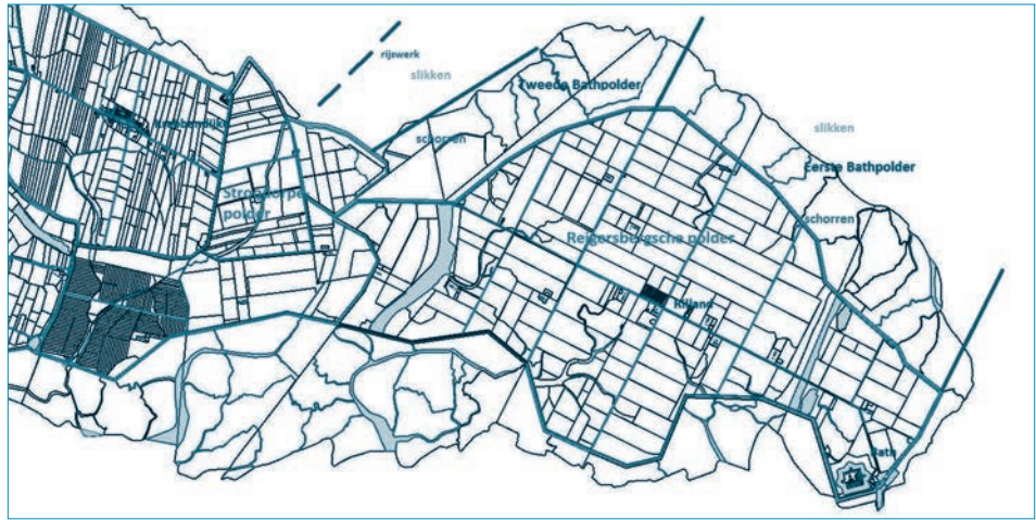
Afb. 2. Kadastrale minuutplans Rilland-Bath 1832 (bewerkt).

met als voorwaarde dat eerst een Kanaal door Zuid-Beveland moest worden gegraven, om België tegemoet te komen met een ongehinderde scheepvaart. Met Engels kapitaal begon het project in 1852 en het liep bepaald niet van een leien dakje. Een lijdensweg: problemen met de arbeiders, grote schade door stormen en geldgebrek.