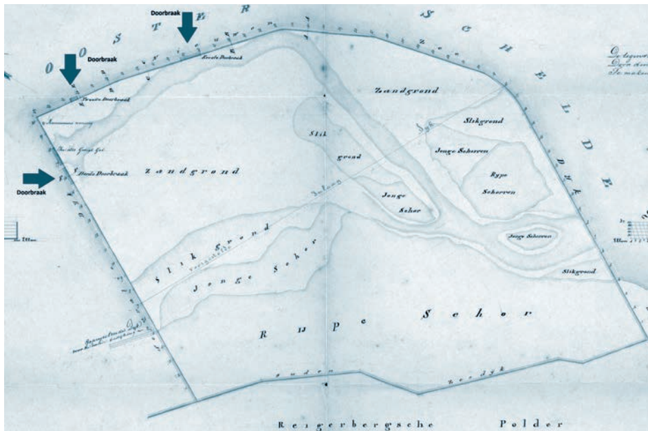
Afb. 5. Stormschade van 26 september 1853 aan de Eerste Polder met drie doorbraakgaten, waarvan er twee op de plek van een voormalige getijdegeul lagen en tot op 0,4 m - NAP waren uitgespoeld. Kaart door J.E.T. Ortt. Zeeuws Archief, tg. 219, NV Landbouwmij. De Bathpolders, NV Zeeuwsche Fruitteelt Mij. inv.nr. 91.

voormalige getijdegeul, waar de dijk uitgespoeld was tot het niveau van die geulen. Hier werd niet gesproken over spoelgaten die ter plaatse van de dijk zouden zijn ontstaan als gevolg van de dijkdoorbraken. Ook de tekening laat daarvan niets blijken. Als er geen, of nauwelijks spoelgaten zijn ontstaan wijst dit waarschijnlijk op het volledig inzakken van het dijklichaam, waardoor er nauwelijks een spoelgat werd gevormd. Verder blijkt uit de grote omvang van de slikken die ingedijkt waren dat er slechts een gering oppervlakte aan rijpe schorren binnen de bedijking heeft gelegen. Kortom: de dijken van de Eerste Polder waren opgebouwd op een te lage en instabiele bodem en voldeden niet aan de gestelde veiligheidseisen van Waterstaat. Het zand uit de slikken, afgedekt met een te dunne kleilaag, deugde niet als bouw materiaal voor de dijken.