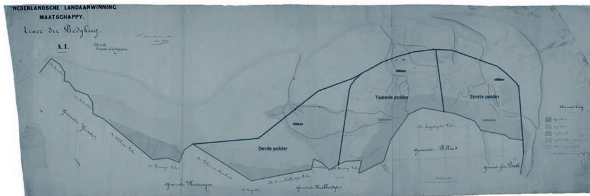
Afb. 4. Ontwerp van drie polders bij Bath-Krabbendijke.