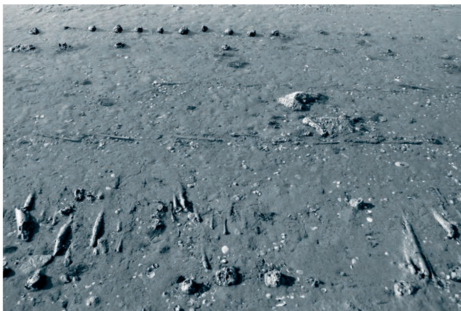
Afb. 1. Rijswerk in de slikken nabij de Stoodorpolder.