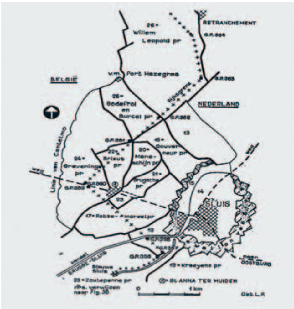
Afb. 3. Kaartje van een aantal internationale polders in de omgeving van het stadje Sluis in West-Zeeuws-Vlaanderen. De kruislijn is rijksgrens tussen Nederland en België.

In dit artikel werd aandacht geschonken aan het fenomeen van de internationale polders en waterschappen in Zeeuws-Vlaanderen. Die waren aanvankelijk ontstaan ten gevolge van de politieke ontwikkelingen in de zeventiende eeuw, waarbij de noordelijke en de zuidelijke Nederlanden in 1664 definitief van elkaar werden gescheiden. 23 In totaal zijn er in Zeeuws-Vlaanderen 23 polders/waterschappen geweest die deels ten noorden en ten zuiden van de in 1664 getrokken staatsgrens lagen. Het waren echter niet allemaal internationale polders/waterschappen in de bestuurlijke betekenis van het woord, te weten één bestuur dat bevoegd was over beide landsgedeelten. Soms gold deze omschrijving voor een polder waarvan slechts een miniem gedeelte aan de overzijde van de landsgrens lag. De Godefroi- en Burkelpolder ten noordwesten van het grensplaatsje Sint-Anna-ter-Muiden is daarvan een voorbeeld. Slechts 0,6 hectare van deze polder lag op Noord-Nederlands grondgebied.