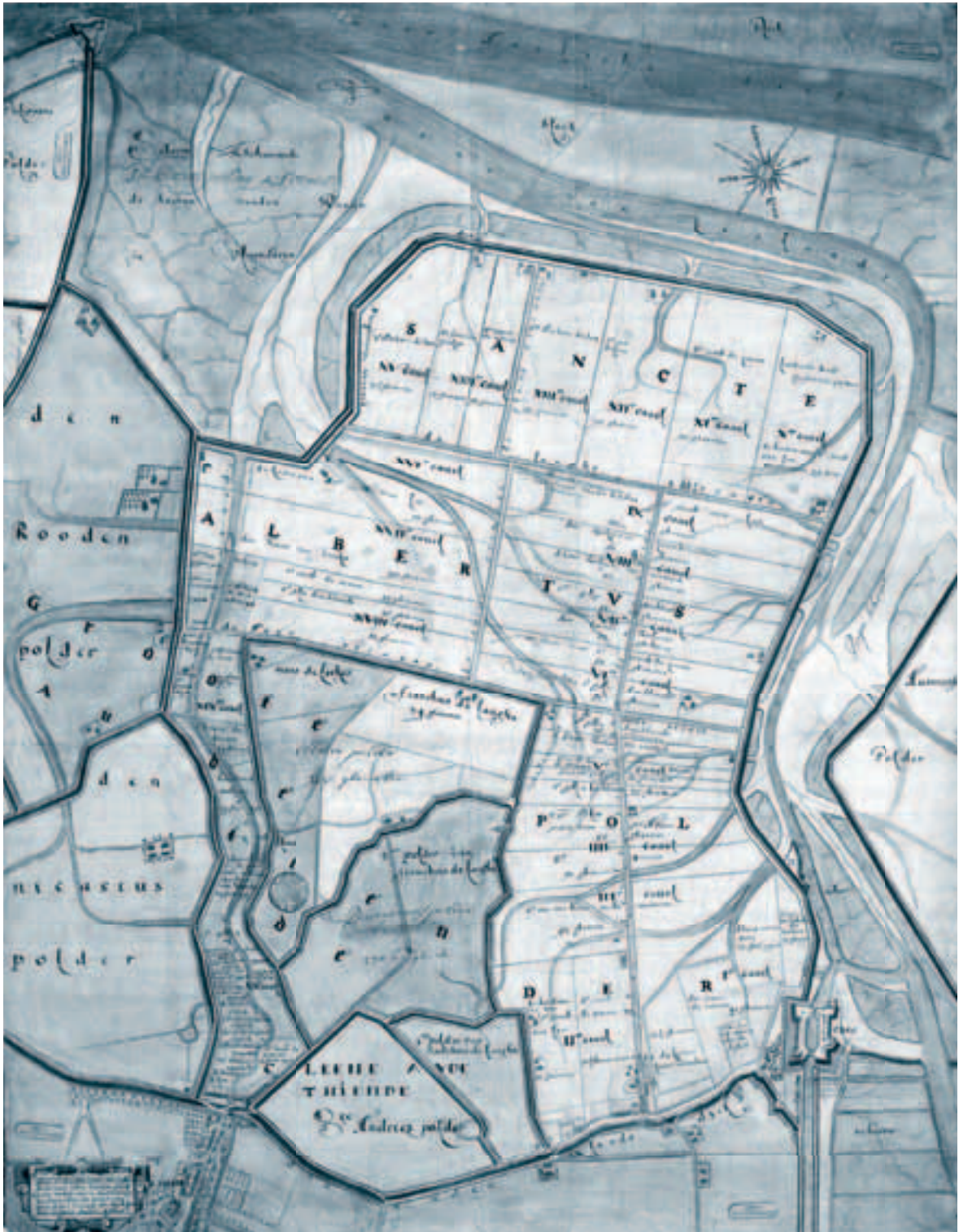
Afb. 1. Kaart van de Albertpolder in 1620, dus van kort na de inpoldering (1612). De kaart werd gemaakt door de Gentse landmeter Lucas Ho(o)re(n)bau(l)t, die bij de aanleg van de polder nauw betrokken is geweest. Hij bezat in de polder diverse landerijen en een boerderij en is er ook nog een aantal jaren dijkgraaf geweest. De limitscheydinghe van 1664 werd dwars door deze polder getrokken en volgde (ten oosten van sas van Gent) de Nieustraete en Geulestraete tot aan de Langhestraete. Vanaf hier liep de grens in westelijke richting tot aan de zeedijk. Van daar liep de grens verder in westelijke richting langs de buitenteen van de dijk. Rijksarchief Gent, kaart nr. 672.