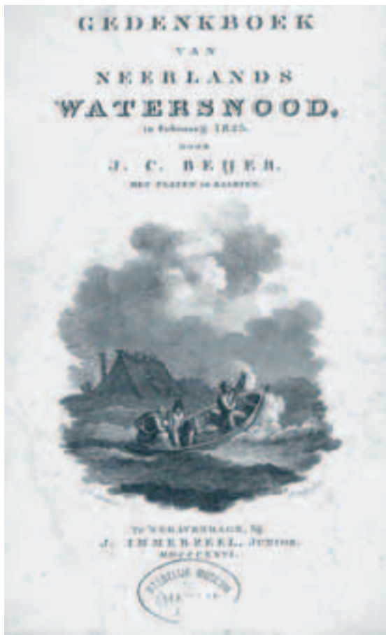
Afb. 3. Titelblad van J.C. Beijer, Gedenboek van Neerlands watersnood. Bibliotheek Regionaal Archief Alkmaar signatuur 64 B 1.