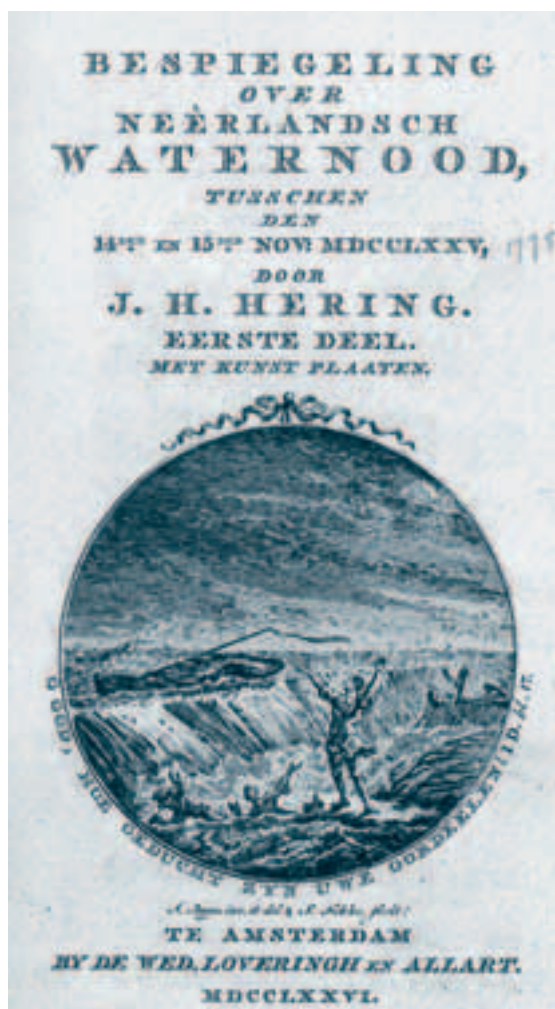
Afb. 1. Titelblad van J.H. Hering, Bespiegeling over Neêrlandsch waternood, tusschen den 14den en 15den nov. MDCCCLXXV. Regionaal Archief Alkmaar bibliotheek signatuur 16 B 13.