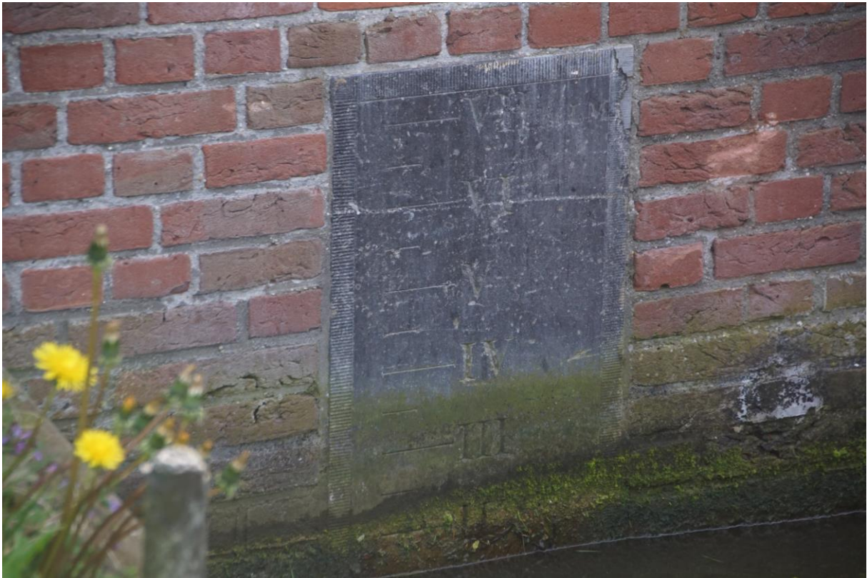
(peilschaal Midlumerlaan, afb. ve)

Deze hardstenen peilschaal zit op een verborgen plek aan de Midlumerlaan in Harlingen in de muur van het Midlumerpypke. Op de Waterstaatskaart 1 e editie staat de naam van dit water: Sexbierumertrekvaart. Dit was de vaarverbinding tussen Sexbierum via Harlingen naar de Trekvaart Harlingen-Franeker. Op het punt waar de vaart de voormalige weg naar Midlum , de huidige, Midlumerlaan passeert is de brug met deze peilschaal.