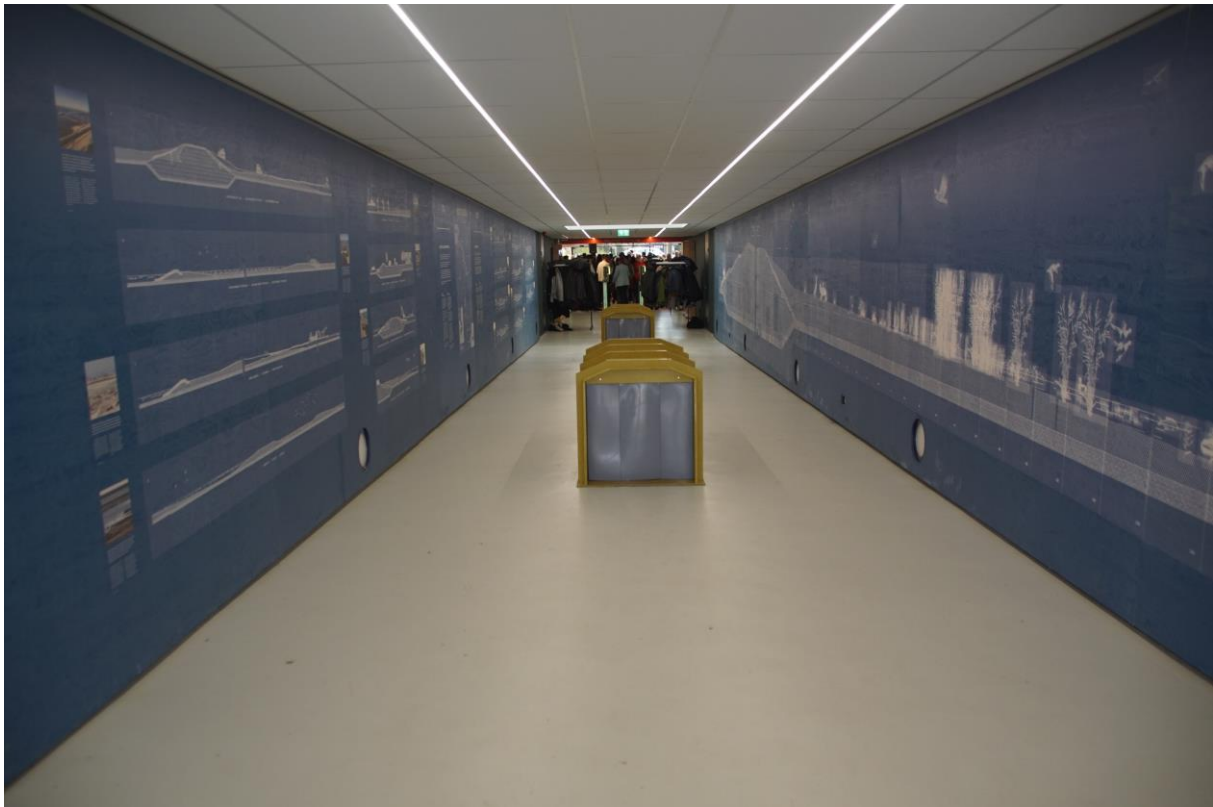
(Dijkdoorgang in de Houtribdijk N 307 Enkhuizen-Lelystad, afb. ve).

Zowel het ZZM als het Hoogheemraadschap Hollands Noorderkwartier willen de bezoeker duidelijk maken dat er een dijk met weg boven het hoofd ligt en hoe het dijkprofiel er uitziet.