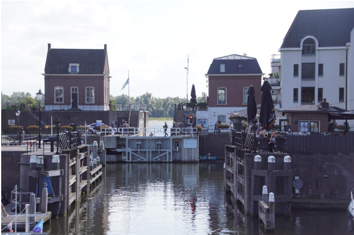
De Lingehaven met de Boven Merwede op de achtergrond (afbeelding ve)

De VWG is een keer in Gorinchem geweest toen het Hoogheemraadschap van de Alblasserwaard en Vijfheerenlanden nog een kantoor had in de Doelen aan de Molenstraat in Gorinchem.