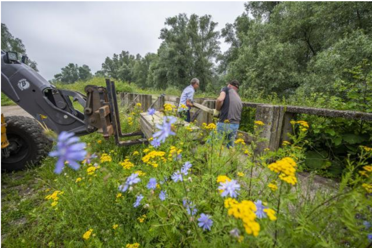
Afbeelding: Waterschap Rivierenland: Sluiten van een coupure bij Gendt

Niet alleen Limburg heeft last van het water ook waterschap Rivierenland heeft inmiddels dijkbewaking ingesteld omdat de „Maasgolf” vanuit Limburg ook door het gebied van dit waterschap komt. De afbeelding is van 14 juli op een moment dat de toen vermoedelijke hoogste waterstand nog niet was bereikt.