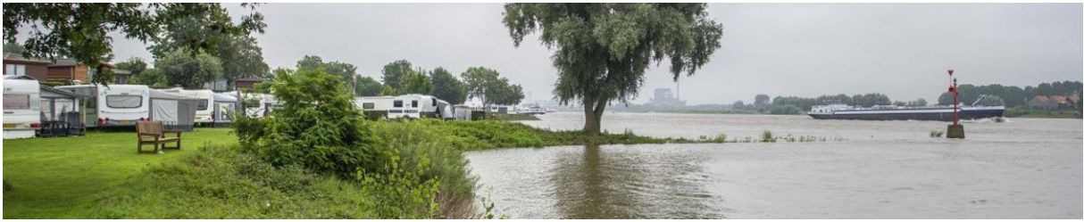
Afbeelding: Waterschap Rivierenland bij Klein – Groot Altena

Niet alleen Limburg heeft last van het water ook waterschap Rivierenland heeft inmiddels dijkbewaking ingesteld omdat de „Maasgolf” vanuit Limburg ook door het gebied van dit waterschap komt. De afbeelding is van 14 juli op een moment dat de toen vermoedelijke hoogste waterstand nog niet was bereikt.