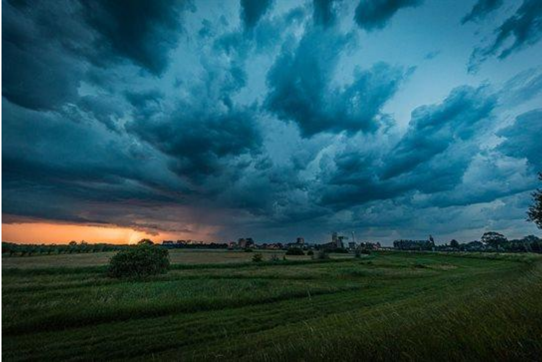
Afbeelding: Waterschap Aa- en Maas. Donkere lichten boven 's Hertogenbosch aan de vooravond van het noodweer.

Hoogheemraadschap De Stichtse Rijnlanden (Houten)