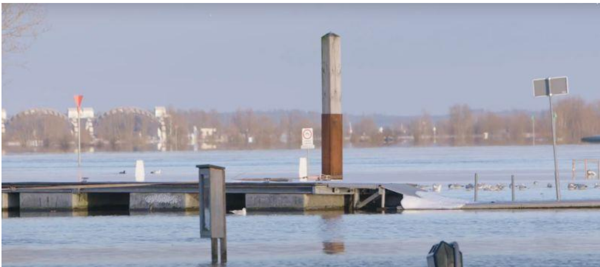
situatie bij de Nederrijn en Lek

Hoogheemraadschap De Stichtse Rijnlanden (Houten)